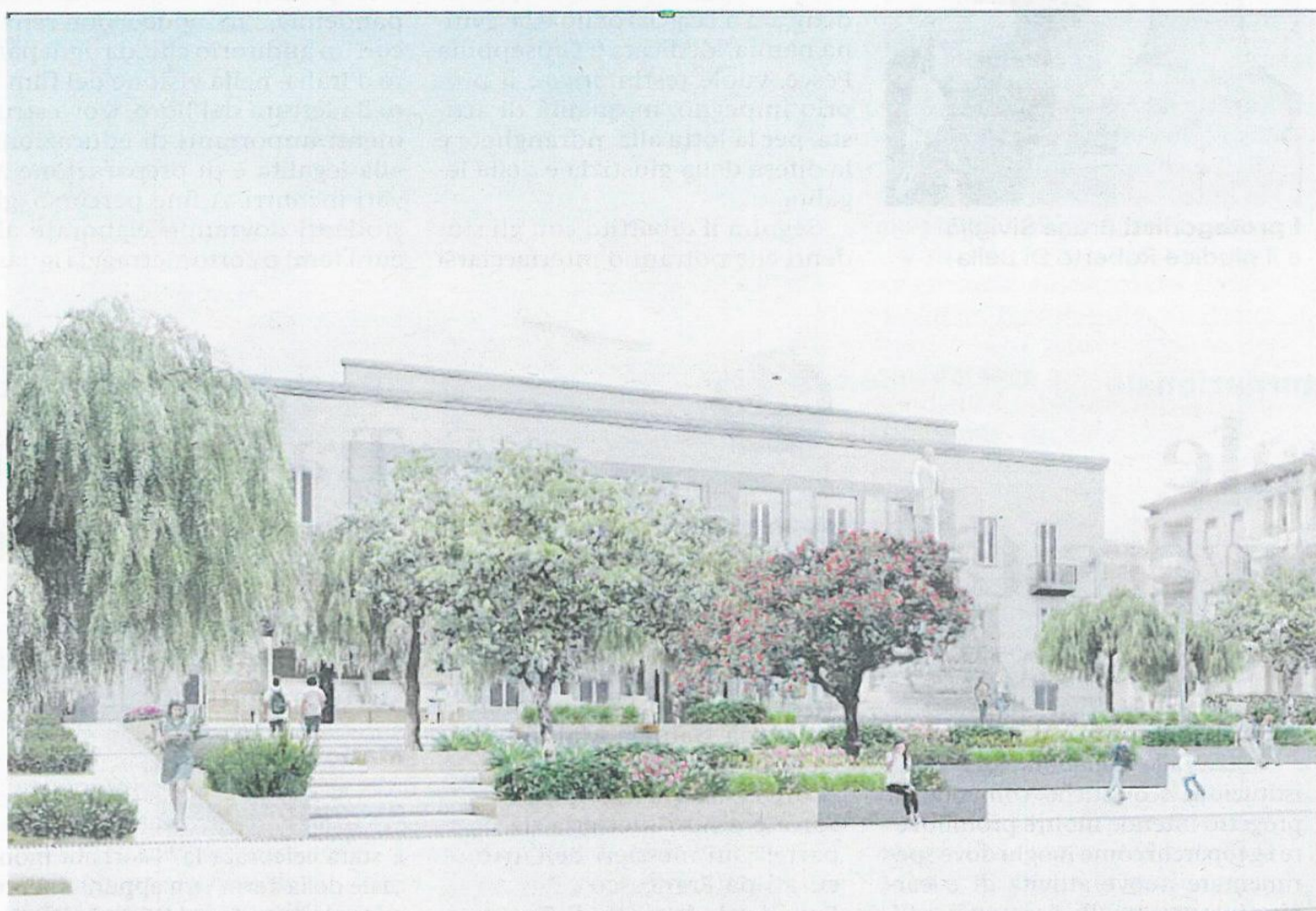
Rendering Il progetto ideato dal Segretariato del Mibact per la riqualificazione di Piazza De Nava

I soggetti coinvolti nel procedimento di riqualificazione di Piazza De Nava e i portatori di interessi diffusi e che hanno manifestato molta attenzione sul progetto che