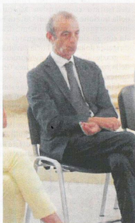
Direttore Salvatore Patamia guida il Mibact in Calabria

sono: Accademia del tempo libero, Soroptimist, Associazione 50 e più, Associazione Amici del Museo Nazionale di Reggio Calabria, Diagonal, Fondazione Mediterranea, Associazione "Imprese Centro Commerciale Naturale Piazza De Nava, Lions Club Reggio Calabria Host, Rotary Club Reggio Calabria Nord, Touring club, potranno fare pervenire eventuali osservazioni entro il prossimo 30 aprile e nel caso in cui ancora non si troverà la quadra si terrà una conferenza di servizi in modalità ordinaria il 5 maggio a